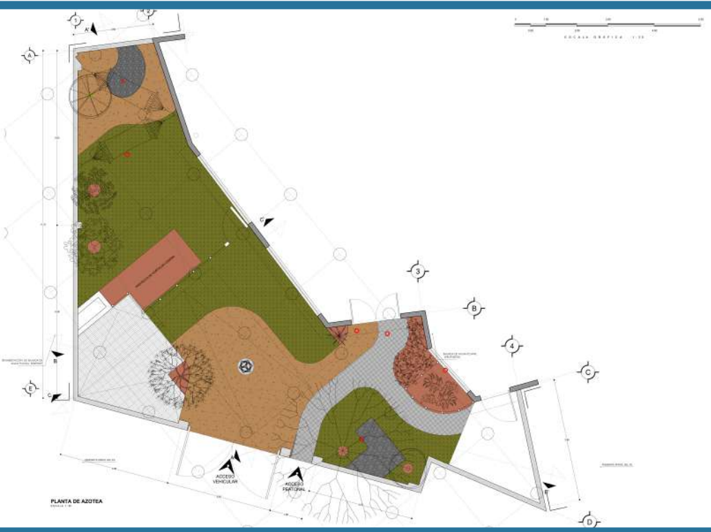
REMODELACIÓN JARDÍN FAMILIA CASTILLO SALINAS 98 m 2 Cerrada de Río Balsas No. 21 Colonia Boulevares de San Cristóbal Ecatepec de Morelos, Estado de México