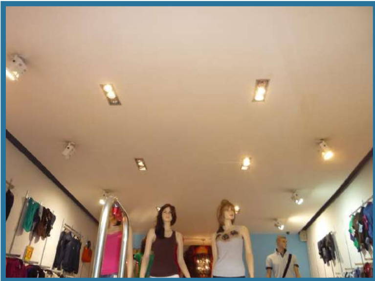
PLANETA X – PLAZA OUTLET TOLUCA 90 m2 Toluca, Estado de México