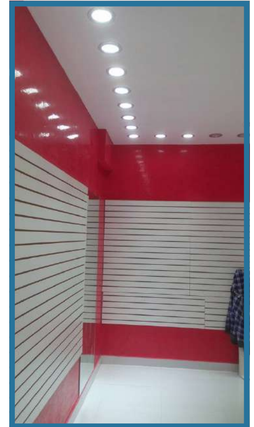
UNLIMITED - LOCAL COMERCIAL 40m2 Plaza las Américas Boca del Río, Veracruz