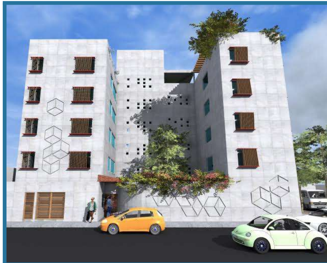
EDIFICIO HABITACIONAL CON ENFOQUE BIOCLIMÁTICO 550 m 2 Calle Hidalgo No. 40 Colonia Apatlaco, Del. Iztapalapa, Ciudad de México